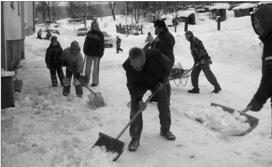
Po shoení ledu a zmrzlého sněhu z okrajů střechy pomocí plošiny následoval ruční úklid.