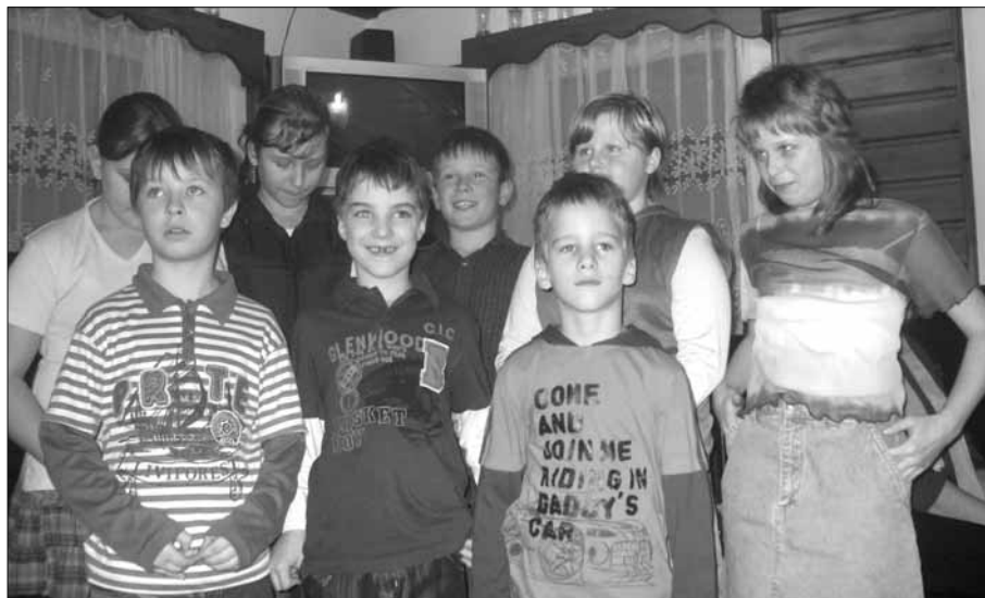
Děti přejí ženám k jejich svátku na schůzi Jednoty SD.