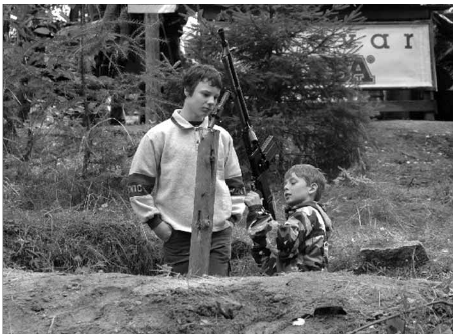
Vítězové dětského kvízu bývalého občasníku „Sněžník“ se seznamují s kulometem.

Děkujeme vám za zájem o záchranu naší historie a památek na všechny příslušníky ozbrojených sborů první republiky, z nichž jich mnoho padlo při resortní službě, na hranicích nebo za 2. světové války.