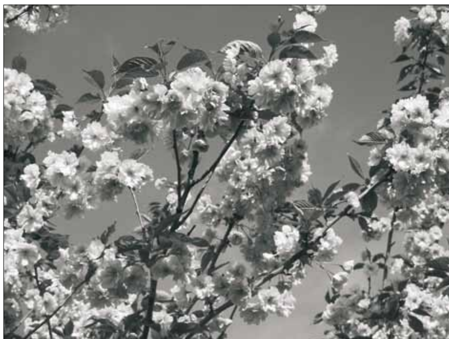
Po dlouhé zimě tu máme opět vytoužené jaro. Mrazivá rána nás ještě na konci apríla trochu potrápila, ale nový život se již nezadržitelně dere ke slunci.

Novému zastupiteli přejeme hodně úspěchů v práci pro obec a její občany.