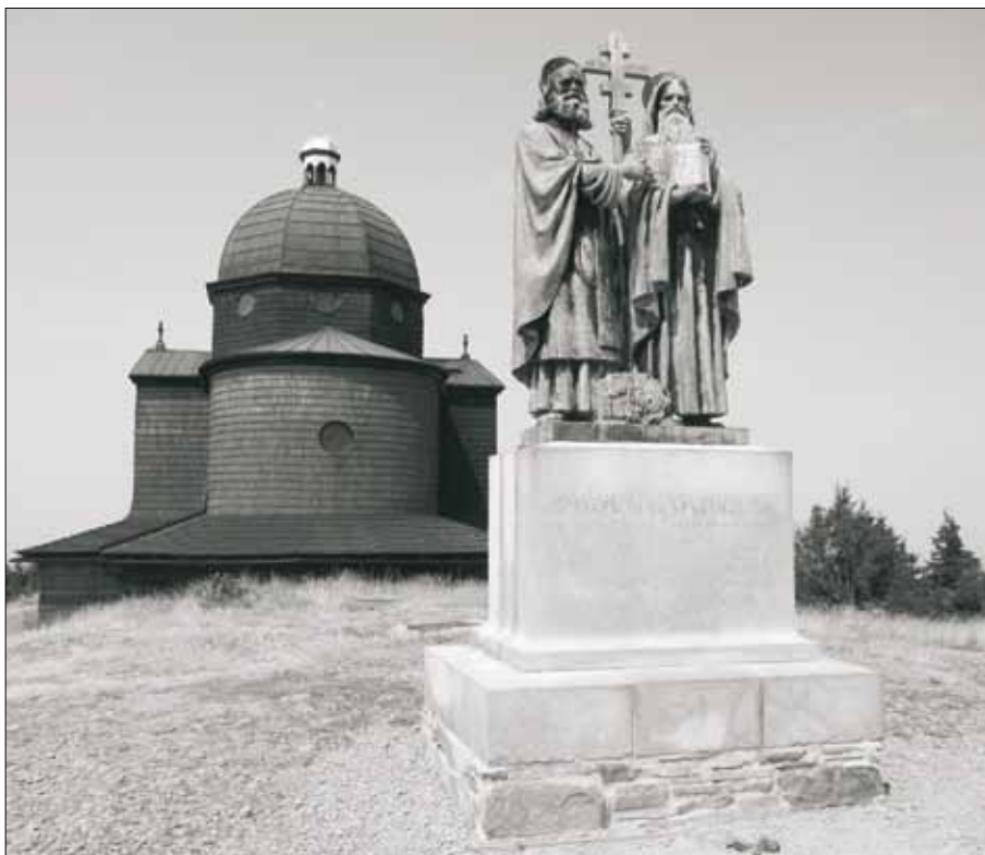
Svatí Cyril a Metoděj na Radhošti v Beskydech.

Cyrilometodějská tradice je stále uznávána všemi slovanskými národy. Pro Moravany samotné je přímo zkratkou moravských národních dějin, potřebnou pro soužití Moravanů, Slezanů a Čechů v jednom státě. Tvoří protiváhu tendencím prosazovat pouze tradici svatováclavskou, která však nepřekročila zdaleka hranice středoevropského prostoru takovým způsobem, jako cyrilometodějská. Tradice začíná obecně nějakou událostí nebo souborem událostí, které jsou samy o sobě jen jednou mezi stovkami dalších událostí. Pokud se v průběhu