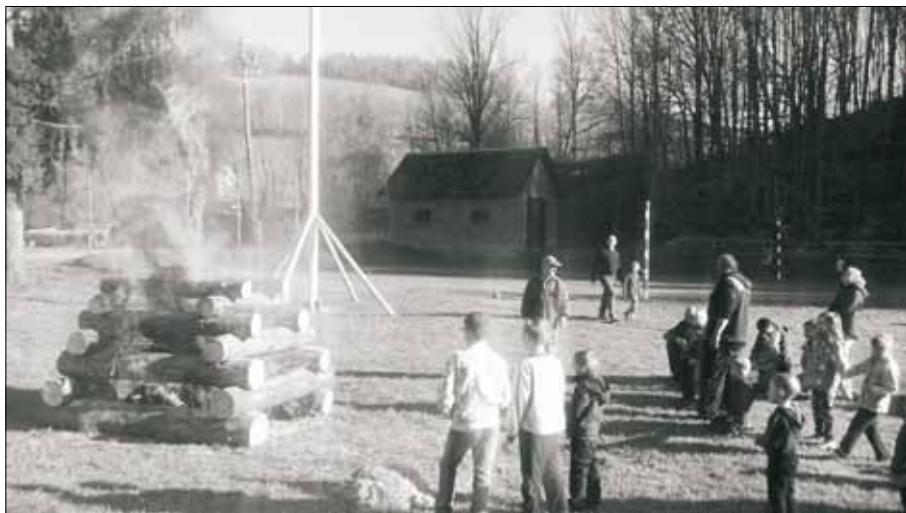
Pálení čarodějnic a stavění máje 29. dubna u obecního úřadu.

Pečivo (nejlépe den staré) nakrájíme na kostičky a přelijeme vlažným mlékem. Kopřivy spaříme vařící vodou, nesekáme na malé kousky, smícháme s nakrájenou slaninou, osolíme, opepríme, přidáme trochu květu a přimícháme k pečivu. Dochutíme a nakonec vmícháme sůl z bílků. Nandáme do vymazaného pekáčku a pečeme v předehřáté troubě na 190 stupňů asi 30 minut.