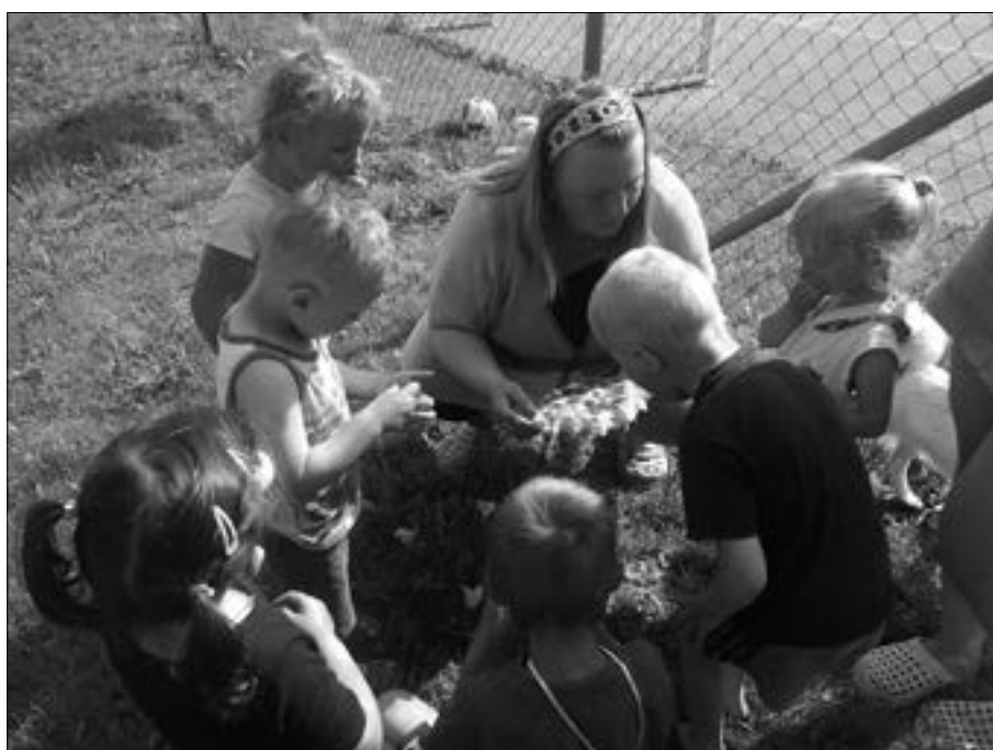
Celosvětový svátek všech dětí slavíme také u nás. Obrázek je z letošního Dětského dne, který se slavil ve Vojtíškově.