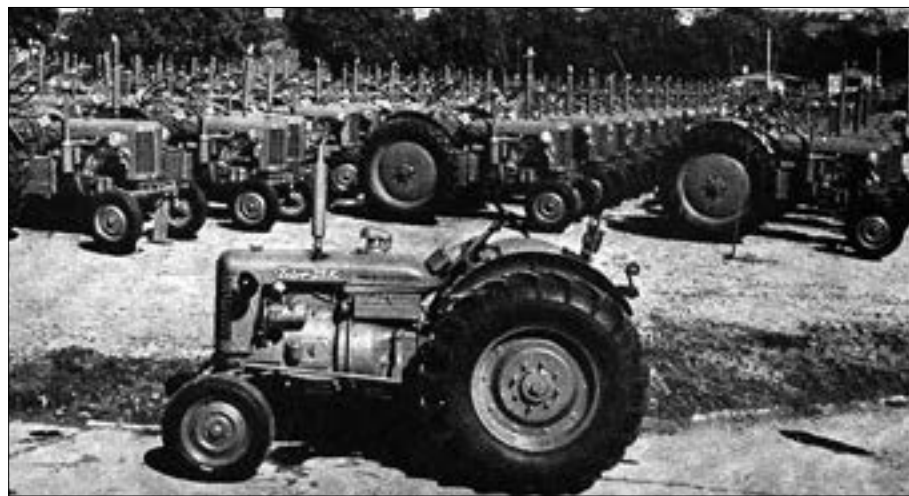
Historie značky Zetor