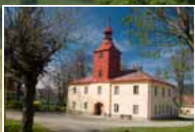
Radnice v Podlesí