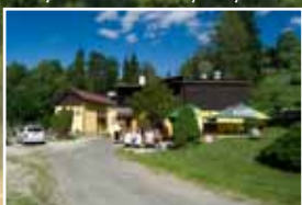
Rybářská bašta Vysoký Potok