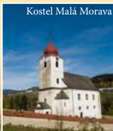
Kostel Malá Morava