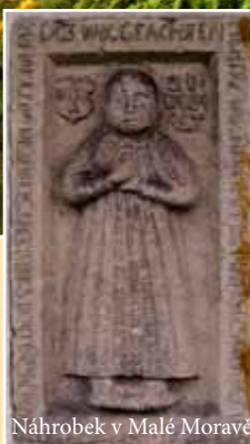
Náhrobek v Malé Moravě