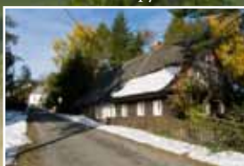
Chalupy ve Skleném