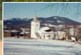
Podlesí a Srážná v pozadí