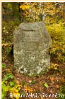
Pomníček U Skleného

V okolí Dolní Moravy a Králík je možnost navštívit objekty pohraničního opevnění, svahy u Vysoké a Vojtíškovy jsou zajímavé výskytem tzv. zemědělských valů - polních teras dnes většinou využívaných k pastevectví. Mimo to jsou odtud úchvatné pohledy na Jeseníky.