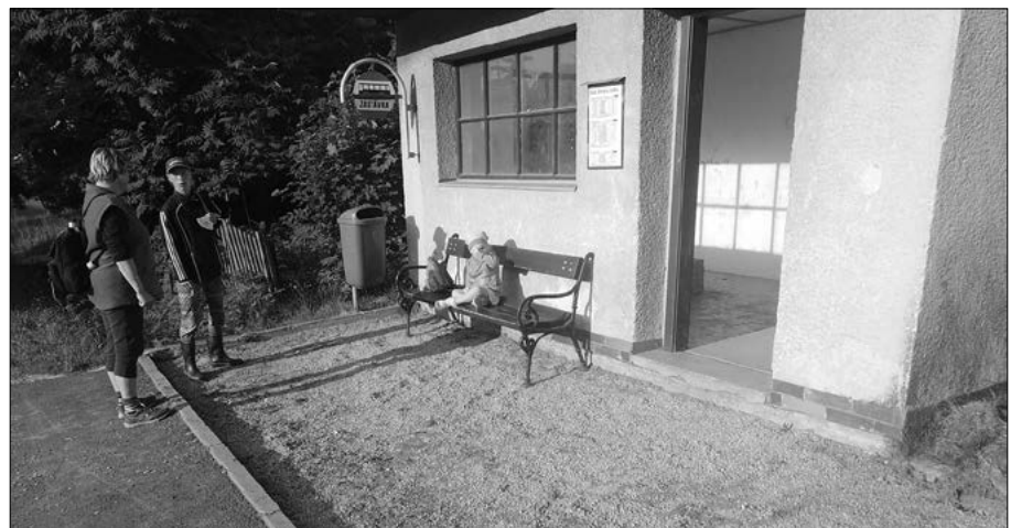
V létě se i u nás na mnoha místech opravovalo, například autobusové zastávky. Jen aby to hezké alespoň chvíli vydrželo...