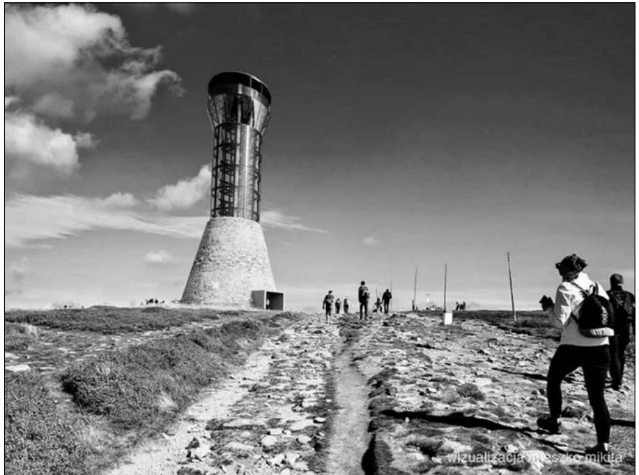
Takto by podle vizualizace měla rozhledna na Sněžníku vypadat.