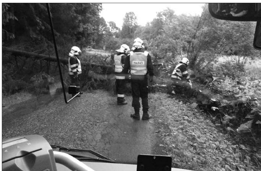
V noci 24. června si zle zařadila bouřka, při níž padaly i stromy. První ranní autobus tak dostal dvacetiminutové zpoždění, když před jedním z nich čekal na příjezd hasičů.