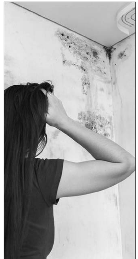
Plísním se daří v nevětraných místnostech.