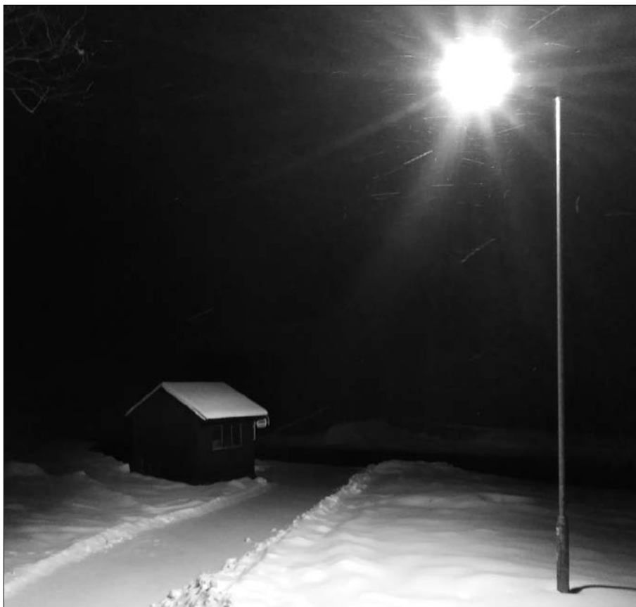
Ráno pod Vojtiškovem