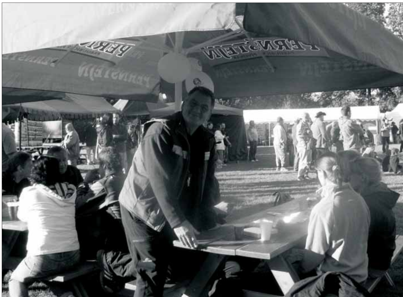
Hřiště Sokola Malá Morava se 11. srpna opět stalo dějištěm Malomoravských slavností, akce plné atrakcí a skvělé zábavy.