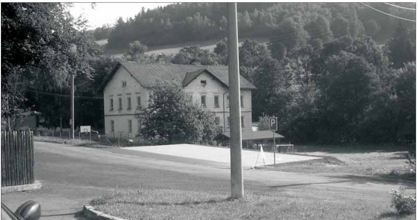
Řidičům v centru Malé Moravy, nedaleko pomníku padlým z první světové války, slouží nové parkoviště.