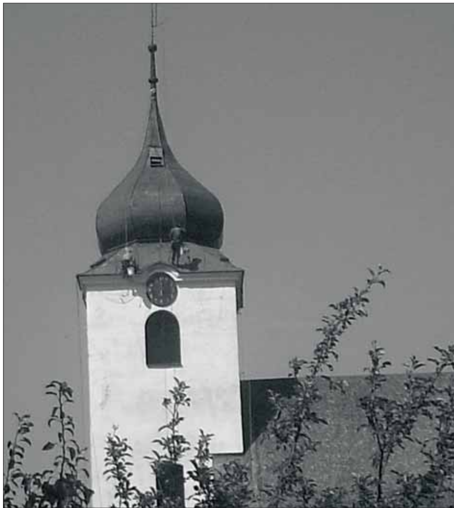
V letošním létě dostala nový asfaltový povrch cesta ke kostelu. V srpnu se pak místním naskytl adrenalinový obrázek. Skupina horolezců natírala věž našeho farního kostela.