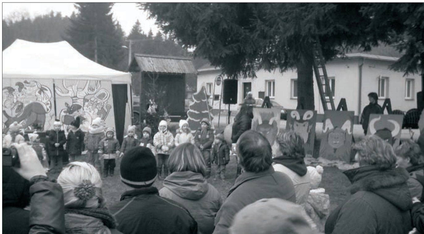
V pátek 28. listopadu jsme u obecního úřadu opět rozsvěcovali náš vánoční strom. Vystoupily tu děti z Mateřské školy Malá Morava a děti z hudební školy Yamaha z Bohdíkova. K dobré zábavě hrála skupina Protektor.