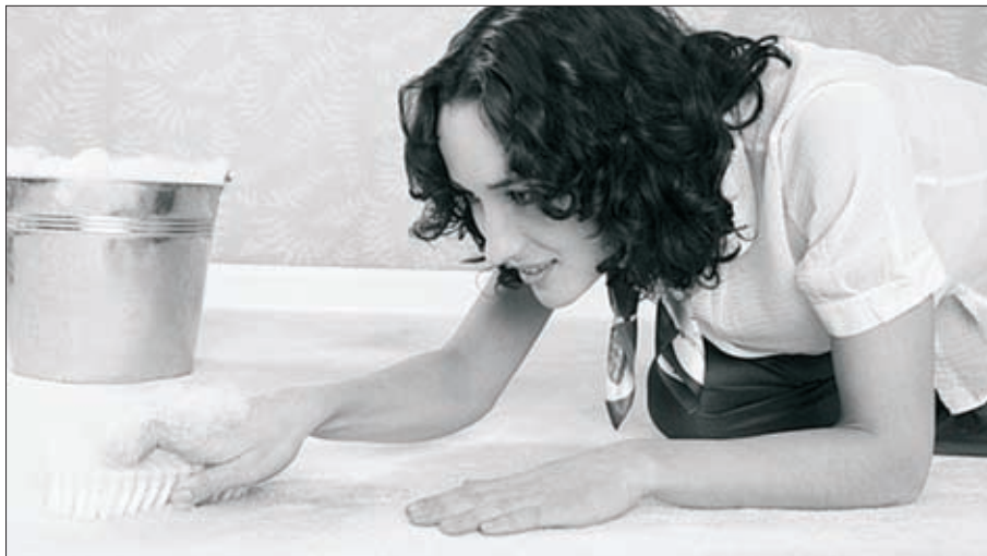
(Malé předvánoční zamýšlení)

Přichází vánoční čas a s ním také činnost, které se říká předvánoční úklid. Je třeba ještě zdůraznit, že někdo předvánoční úklid vůbec nedělá, neboť má uklizeno po celý rok, někdo zase nemá co uklízet. Někoho uklízení vůbec nebaví, někdo uklízení v domácnosti doslova nenávidí. To se týká především mužů. U žen je to právě naopak. Je to povětšinou jejich oblíbený sport po celý rok a před Vánoce mi obzvláště.