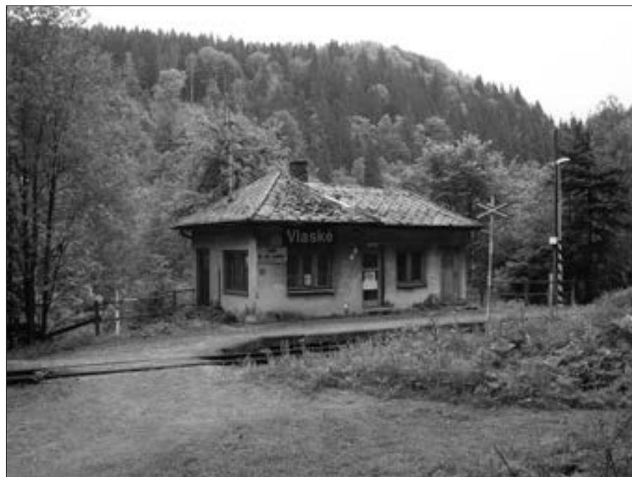
Už je tomu sedmdesát let, přesně 1. února, co bylo zrušeno místo strážníka a pokladníka na vlakové zastávce ve Vlaském. Také železnice zaznamenala postupný odliv cestujících a Vlasko je dnes jen zastávkou na znamení pro víkendové vlaky.