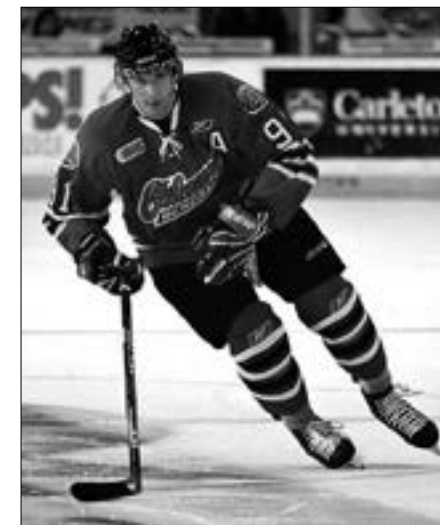
Olšováčka připravil Petr Mahel

Lední hokej ale vznikl v Kanadě, kde je národním sportem.