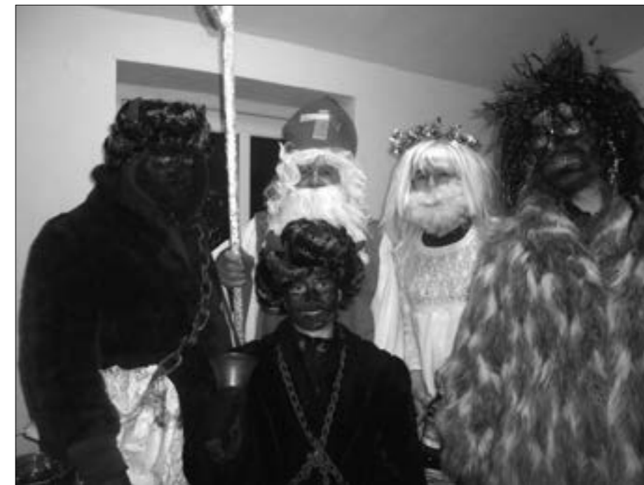
Svatý Mikuláš s doprovodem se na své pouti nezapomněl zastavit ve Vojtíškově.