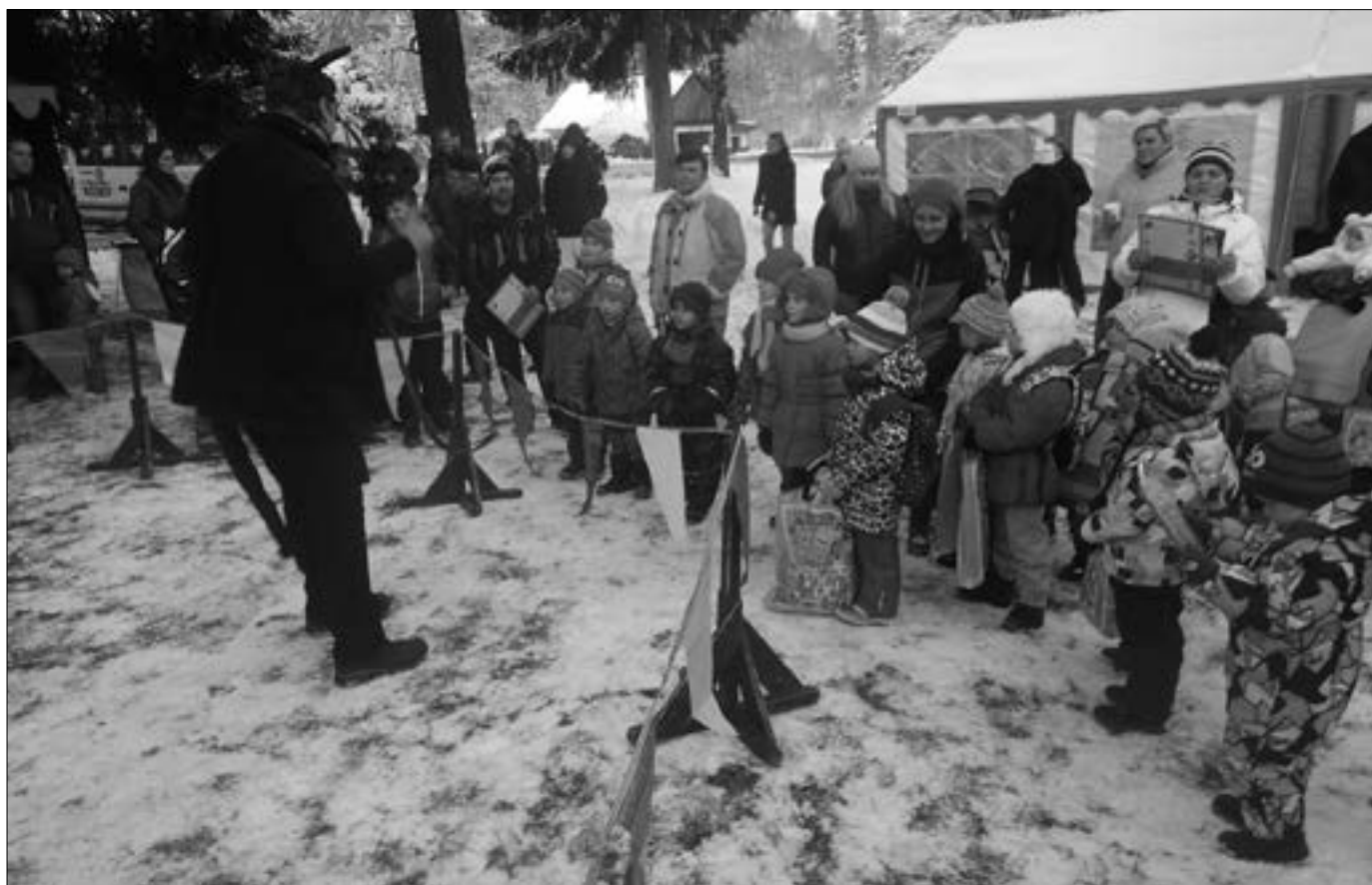
Každoroční rozsvěcování vánočního stromu pod obecním úřadem bývá přeci jen největší radostí pro děti.