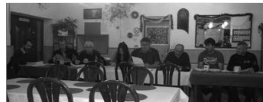
Obrázek z listopadového zasedání zastupitelstva obce ve Vojtíškově. Úplný zápis z jednání přineseme spolu se zápisem z prosincového v příštím čísle Devítky.