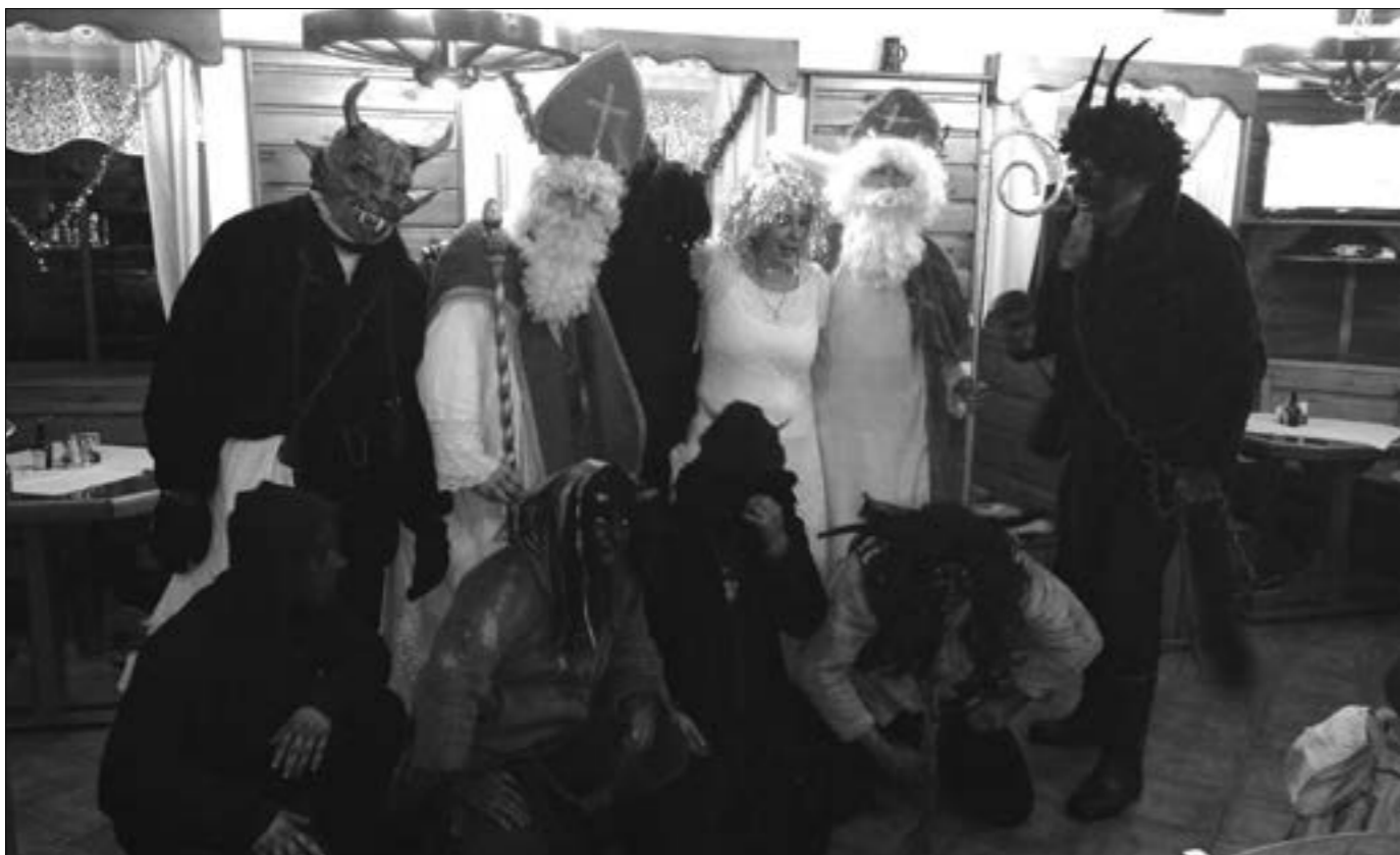
Je vidět, že se tradice udržují i na Malé Moravě, a tak i naše děti překvapil večer 5. prosince Mikuláš se svou družinou. Po občůzce si pak na chvíli odpočinuly hned dvě družiny v naší hospodě.