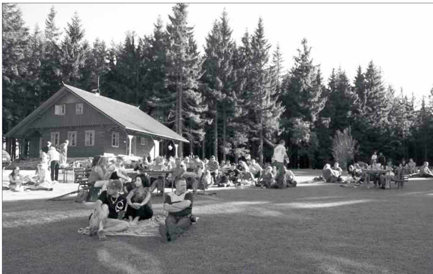
Snímek z IX.ročníku Burčákových slavností na Severomoravské chatě. Konaly se ve dnech 1.-2. října, v krásné dny babího léta. Oblíbený burčák byl z Březi u Mikulova. Nechybělo pečené prase, cimbálová muzika...