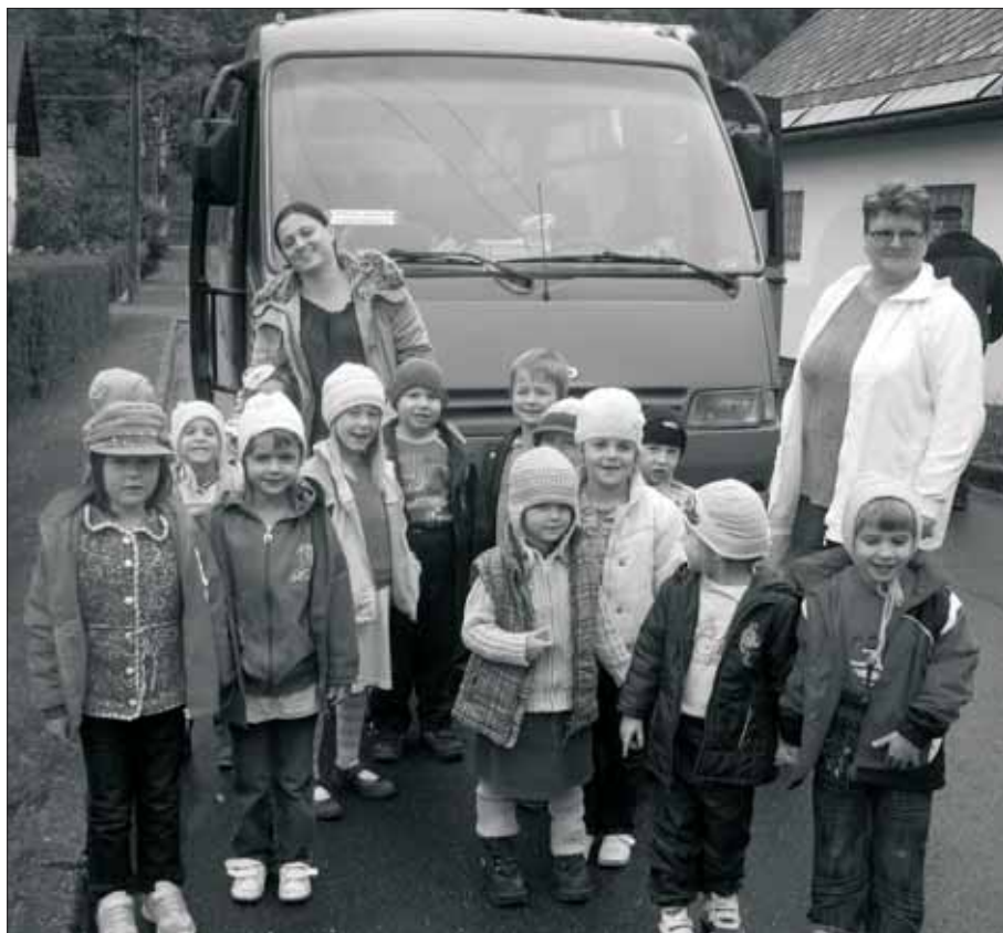
Děti z naší mateřské školy v letošním školním roce navštívily představení v hanušovickém kině a divadelní představení v Králíkách.

Od té doby řeka Morava teče do Černého moře, Nisa do Baltského a Orlice do Severního. Tak dívky zůstaly na Klepáči, ale odchází každá na jinou stranu. A Sněžník, ten kraluje stále ve svém království na rozhraní Čech a Polska.