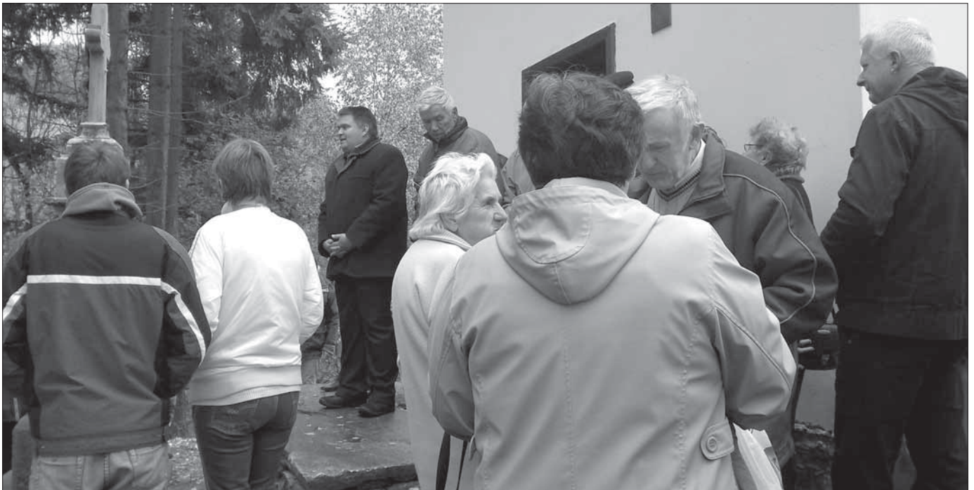
V sobotu 8. října proběhlo na Vysokém Potoku slavnostní žehnání kapličky Panny Marie Růžencové.