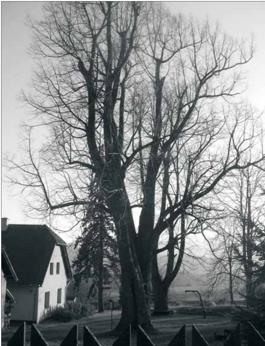
Památná lípa u bývalého polesí u Mizerů ve Vojtiškově má obvod kmene úctyhodných 445 cm a výšku 25 metrů.