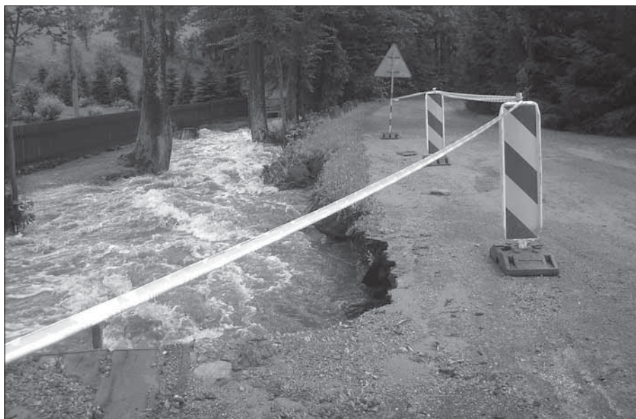
Je až k neuvěření, že nás v červenci letošního roku zasáhla blesková povodeň. I díky teplému podzimu se mohlo pracovat na opravách škod. Snímek je z Malé Moravy.