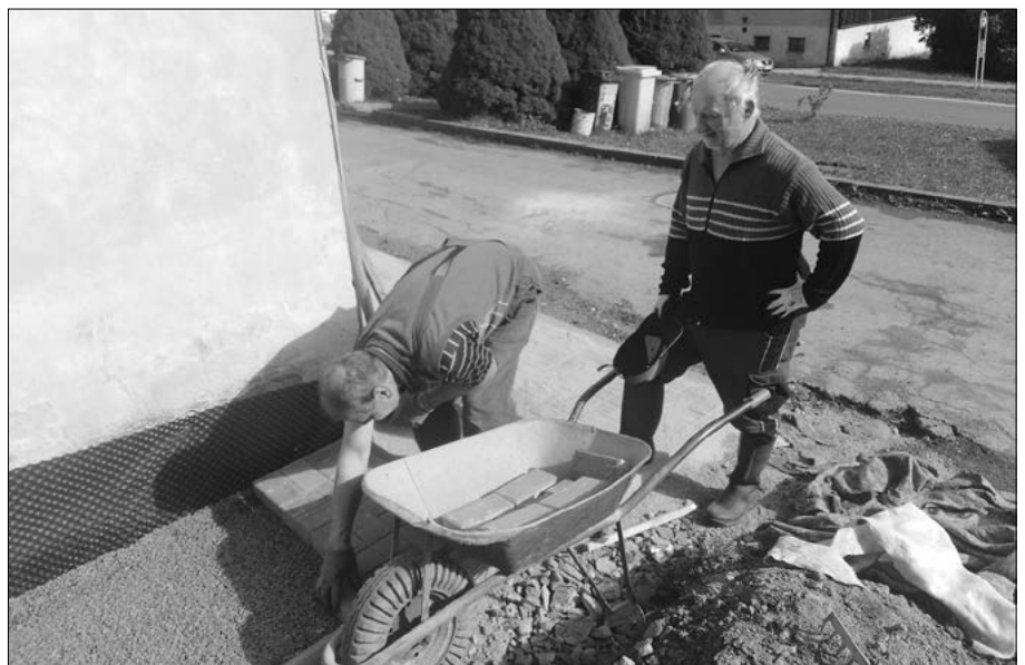
Letos se pracovalo také na odvodnění bytovek na Malé Moravě.