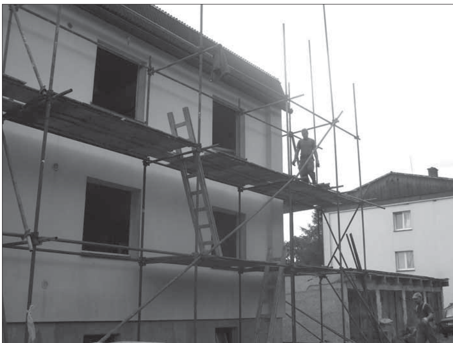
Rekonstrukci střechy na bytovkách ve Vojtíškově provádí Krovstav Hanušovice.