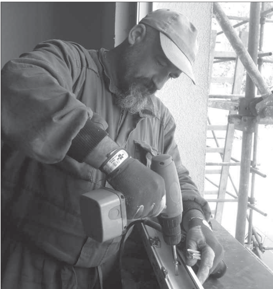
Výměnu oken ve Vojtíškově letos provedla firma ABC okna z Králík. Měnila se stará dřevěná za nová plastová.

Pro mnohé lidi jsou však moderní kotle příliš drahé. Zatímco za klasický dají 15 až 20 tisíc, automatický vyjde na 60 až 80 tisíc korun. Proto s pomocnou rukou i letos přichází Státní fond pro životní prostředí - finančně podpoří domácnosti, které si vymění kotle na uhlí za šetrnější alternativu k životnímu prostředí. Podle exministra životního prostředí Martina Bursika jen pro první čtvrtletí letošního roku je připraveno 40 milionů korun.