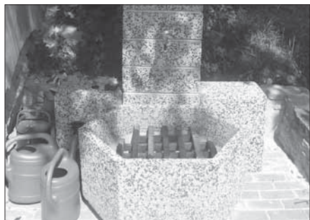
Jak dlouho nám na hřbitově vydrží...

Někteří léčitelé říkají, že do roku 2012 se budou velké pohromy opakovat. Potom prý