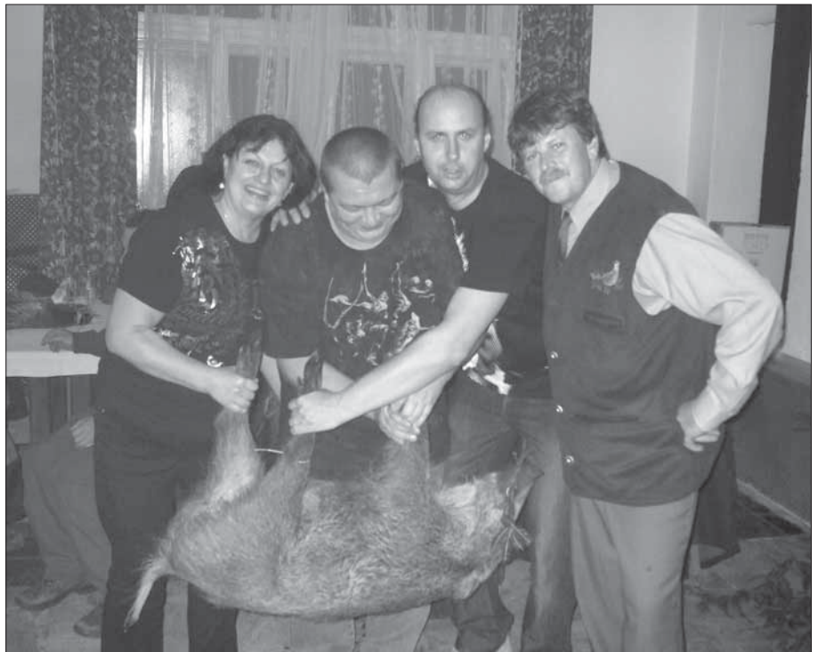
14. listopadu pořádalo myslivecké sdružení HORAL Malá Morava tradiční Poslední leč. K poslechu a tanci hrála skupina Protektor. Hosté si mohli pochutnat na výborné myslivecké kuchyni a v bohaté zvěřinové i věčné tombole vyhrál snad téměř každý.