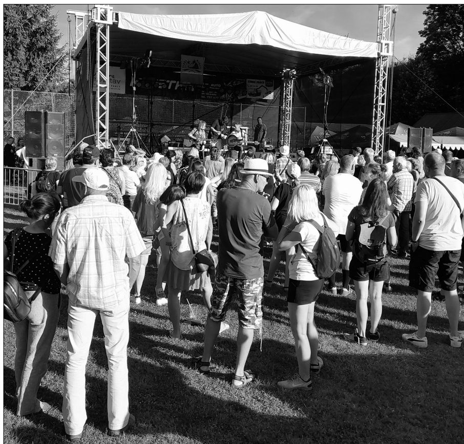
Krátce po uzavěrci tohoto vydání Devítky proběhla na hřišti Sokola Malá Morava v Podlesí největší kulturní akce roku naší obce - Malomoravské slavnosti. Podrobněji se jí budeme věnovat příště.

(Dotazník tvoří vnitřní dvoulist této Devítky, stačí jej pouze vyjmout ze spon, vyplnit a odevzdat na obecním úřadě.)