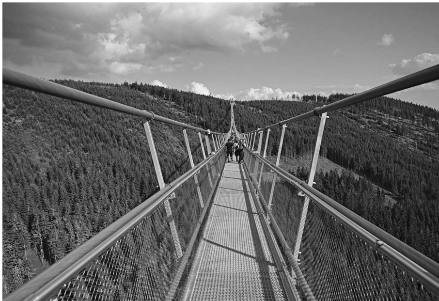
Visutá lávka Sky Bridge je opravdovým adrenalinem pro náročné.

Byl pátek 13. května 2022 a na nejdelší visutý most na světě vkročil na Dolní Moravě první turista. Nová atrakce přilákala za rok téměř 800 tisíc návštěvníků. Sky Bridge 721 získal několik prestižních ocenění. Nyní je po generálním servisu a je připravený na letní sezónu.