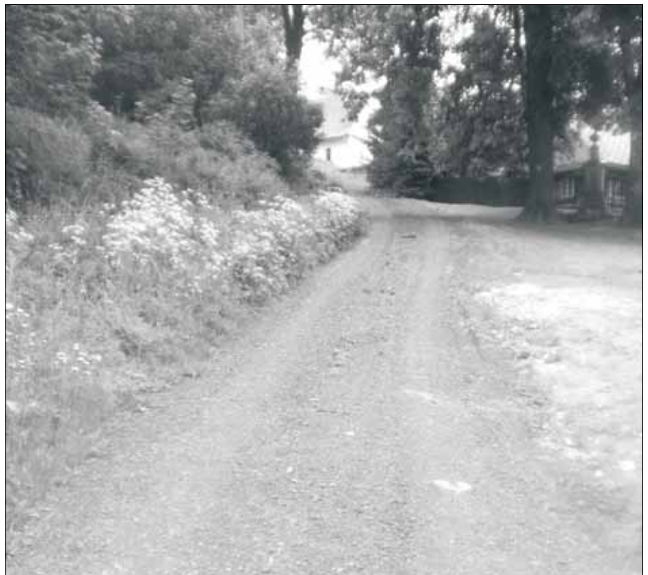
Také letos se investovalo do opravy obecních komunikací, například ve Vojtíškově a na Podlesí.