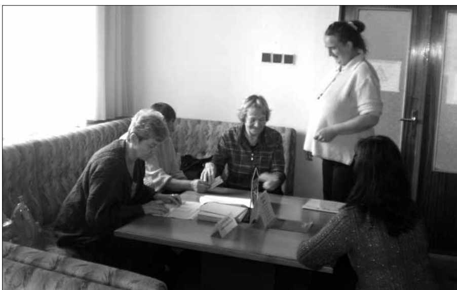
Pohled do volební místnosti okrskové volební komise č. 4.