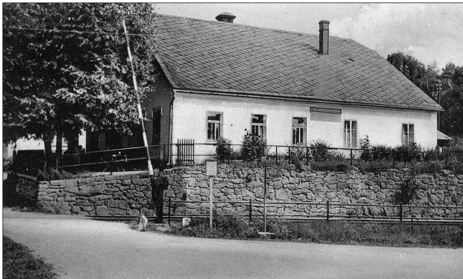
Závory u hospody na snímku z 30. let minulého století.