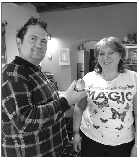
Letos oslavil Velikonoce náš šéfredaktor také u bývalé rodačky z Vysoké. Poznáte ji?