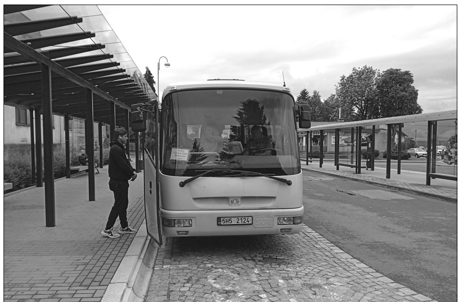
Autobus firmy Pinkas na králíckém autobusovém nádraží.