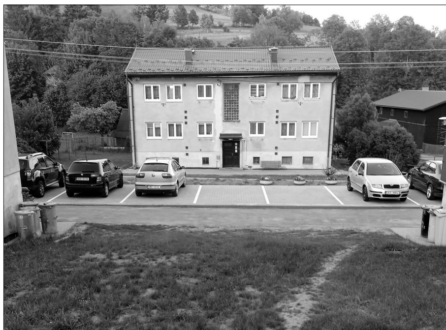
Na Malé Moravě bylo mezi bytovkami vybudováno tolik potřebné parkoviště.