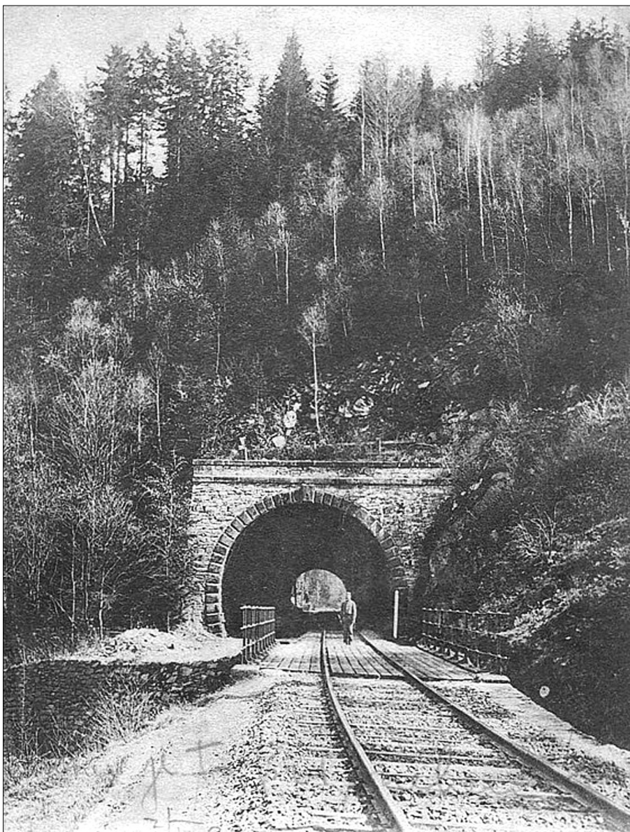
Stavba Moravské pohraniční dráhy se v naší obci proplétala zákruty údolí řeky Moravy a vyžádala si budování řady násypů, zářezů, mostů a tunelů. Na snímku tzv. Vlaský tunel pod Vojtiškovem na dobové pohlednici z počátku 20. století.