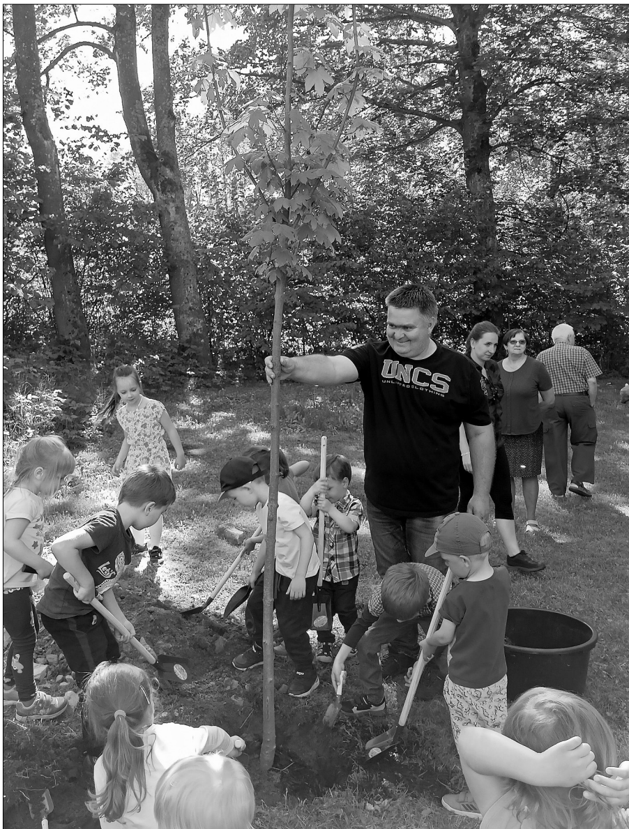
U naší mateřské školy vyrostla letos přírodní zahrada. Více se o ní dočtete na str. 7. Na snímku děti spolu s panem starostou sází nový javor.

Uzávěrka příští Devítka bude mimořádně již 8. srpna 2022